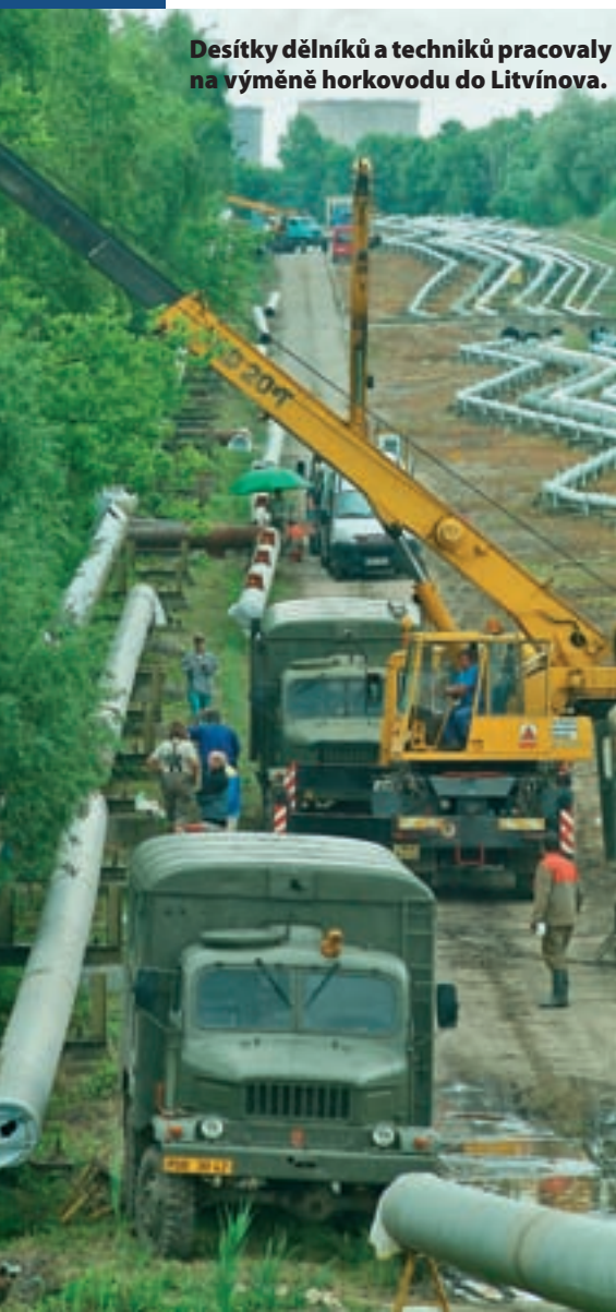
Desítky dělníků a techniků pracovaly na výměně horkovodu do Litvínova.

Půvabné mladé dívky nejsou v teplárně k vidění tak často. Jejich návštěva v United Energy v Komořanech byla o to zajímavější, že dorazily až z Norska. Teplárnu Komořany jako moderní zařízení na kombinovanou výrobu tepla a elektřiny si studenti ze střední školy Videregaende Skole z norského Konsbergu přijeli prohlédnout v rámci své týdenní cesty do České republiky. Do United Energy je přivedli pedagogové z jejich partnerské školy - litvínovské Scholy Humanitas, s níž vloni navázala teplárenská společnost úzkou spolupráci. Studenti z Litvínova absolvovali exkurzi do Komořan týden před norskými hosty. Praxe, stáže a exkurze nabízí United Energy technickým středním školám v regionu v rámci svého programu Teplná Pohoda studentům.